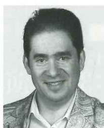
レオニード・ボムステイン (テノール) Леонид Бомштейн

クールにおいて栄冠を勝ちとった。現在、グネーシン記念音楽アカデミーでA.ゴルバチョフに師事しながらロシア国内を中心に積極的な演奏活動を行っている。