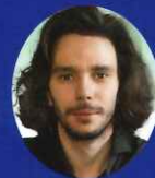
エミル・リヒナー Эмиль Лихнер