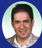
レオニード・ボムシュテイン Леонид Бомштейн