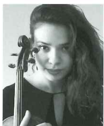
アストヒク・サルダリヤン (ヴァイオリン) Астхик Сардарян

スイスを始め、世界中のオペラ音楽祭へ出演し活発な活動を続ける。現在は、演奏活動を続ける傍ら、母校であるグネーシン音楽大学で後進の指導にあたっている。